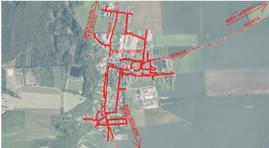
Obrázek 1 - Širší vztahy

Cílem studie je navrhnout řešení a etapizovaný průběh rekonstrukce místních komunikací v obci s předpokladem zpevnění primárně asfaltovým betonem a dále návrh chodníků podél silnic III. třídy.